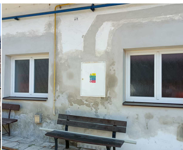
Proběhla také výměna oken v pálenici.