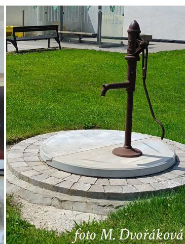
Zrekonstruovali jsme studnu u autobusové zastávky.