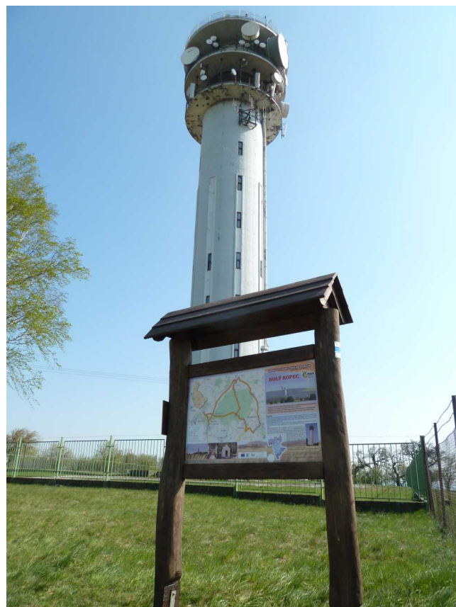
Obnovená informační tabule na Holém kopci