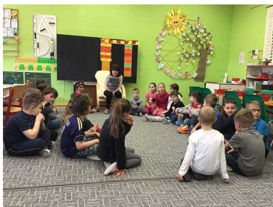
den otevřených dveří v 1. třídě