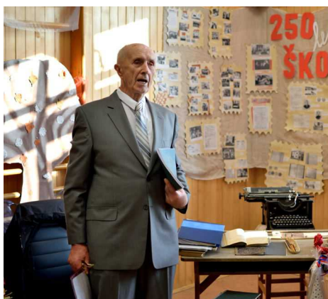
křest knihy o staroveské škole,