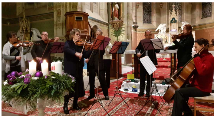
Koncert komorního orchestru

V době svátků vánočních navázal na svátek sv. Štěpána další koncert a to se staroveským rodákem