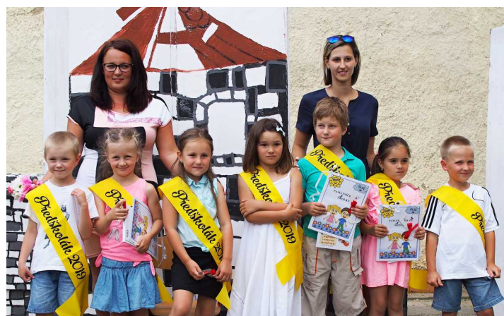
Těšíme se na prázdniny