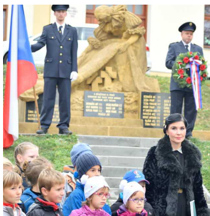
Oslava výročí republiky,

V říjnu loňského roku se naše škola již počtvrté přidala k dobrovolníkům z celé ČR v akci „Pomáhám, protože chci - 72hodin“. Naši žáci sbírali odpadky po celé vesnici a také vysadili před školou lípu malolistou.