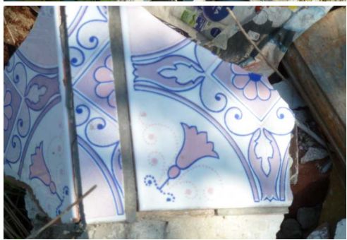
Černá skládky u Gryngle a směrem na Přestavky