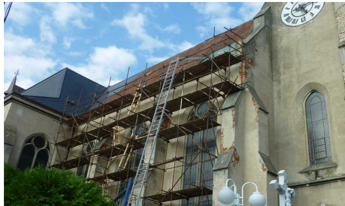
Oprava střechy kostela

V letošním roce proběhlo také slavení velikonočních oslav zmrtvýchvstání Krista. Konala se i tradiční peší poutě do lesa Dubiny ke kapličky.