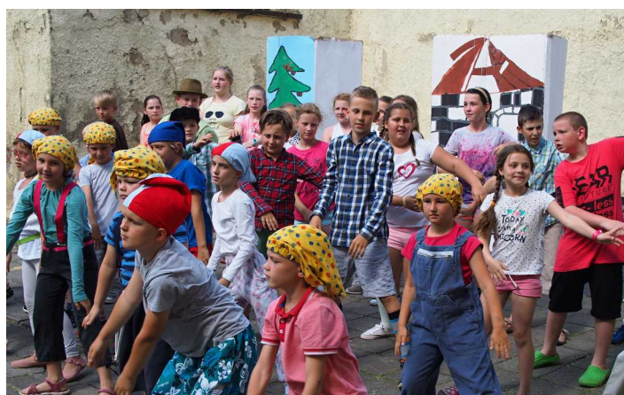
Těšíme se na prázdniny

V e dnech 3. – 7. června 2019 prožily děti ze ZŠ a MŠ ozdravný pobyt na Trojáku. Program celého týdne se nesl v duchu „Živlů“, jako je vítr, voda, oheň a půda. Působení jednotlivých živlů si děti zažily všemi smysly při pokusech, tvoření, výtvarných činnostech i při přednášce amatérského meteorologa. Nechyběly ani výlety. Navštívili jsme rozhlednu „Maruška“, Tesák i nejvyšší horu Hostýnských vrchů – Kelčský Javorník. Celý týden se nám moc líbil.